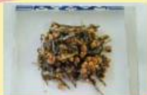
いり大豆とおやついりこのりんかけ 調理時間 20分